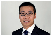
Lyndon Man 英國 倫敦 2013年8月起管理本基 金